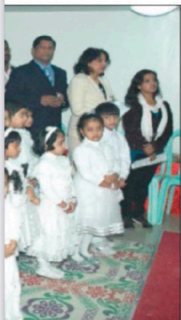
Comunità cristiana nella chiesa di san Daniele Canabini a Jiloh Al-Shaykhah, in Kuwait

«so» ma un rito vivente, forte che tinge nella storia spirituale e che può essere condiviso e trasmesso.