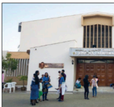
La cattedrale di San Giuseppe ad Abu Dhabi, capitale degli Emirati Arabi Uniti

lanza umana per la pace mondiale e la convivenza umana, firmato ad Abu Dhabi ha dato origine a progetti interessanti riguardanti il dialogo interreligioso. Uno di questi è stato l'inaugurazione nel febbraio scorso della Abraham Family House, la cui prima pietra è stata firmata anche da Papa Francesco. Si tratta di un complesso che comprende una moschea, una sinagoga