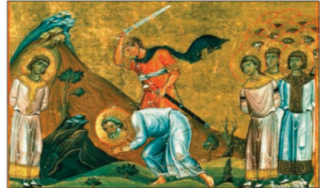
Raffigurazione del martirio di sant'Andrea e compagni in un'antica miniatura

È sempre grazie alla grande disponibilità dei fedeli che le nostre chiese possono disporre dei cori per l'animazione liturgica. La buona celebrazione è anche garantita dai numerosi volontari che si impegnano per il mantenimento dell'ordine durante le celebrazioni, dai lettori, i ministri straordinari dell'eucaristia e i giovani ministri dell'altare (chierichetti). È edificante vedere quanti fedeli